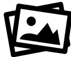
Tournoi Juniors Swisstennis :